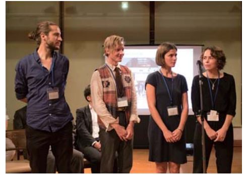
▲9月のオープングレセプション

シヨンを楽しんでいます。私たちは街を自転車で行き、時には道に迷ったり、その末に興味深い場所に辿り着いたりしています。私たちのプロジェクトは利根川(坂東太郎)の物語を集めるものです。守谷市内の流域から、利根川が流れ着く太平洋の犬吠崎までを自転車と徒歩で探検します。利根川については何か物語をご存知の方は、ぜひアーカススタジオへご連絡ください。