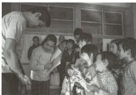
▲昨年のキッズツアーの様子

制作のための材料や制作過程、アーティストたちの発見や興味・関心を直にのぞけるようなおもしろさがあります。海外のアーティストと直接会って話せる、こ