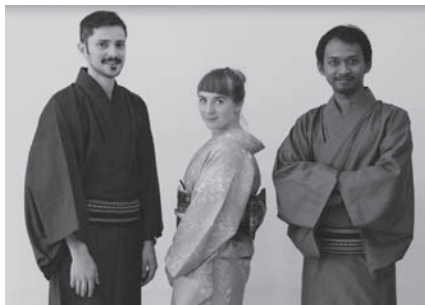
▲また会いましょう！

8月18日に来日して守谷に110日間滞在し、11月に成果発表として8日間にわたるオープンスタジオを行った3人のアーティスト。12月5日に守谷を旅立ちました。彼らの活動にご協力くださった皆さん、オープンスタジオに来場された皆さん、ありがとうございます。彼らの今後の活躍に、どうぞご期待ください。